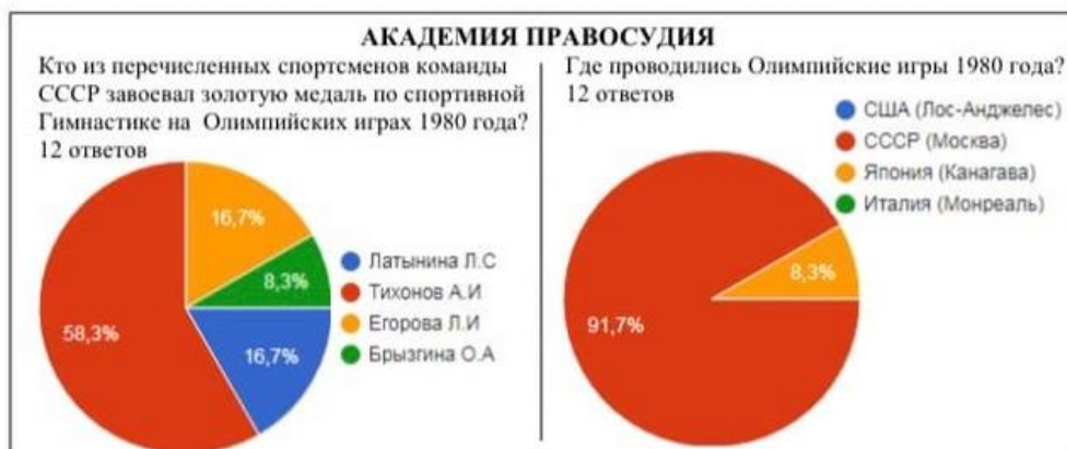
Рисунок 1 – Ответы студентов Академии правосудия на вопросы по истории Олимпиады-80

Всем миром выбирали и кандидата на официальный талисман Олимпиады-80. Ведущий телевизионной передачи «В мире животных» Василий Песков обратился к зрителям с просьбой высказать свое мнение, каким должен быть официальный талисман Олимпиады-80. Вот что позднее писал Песков: «Более сорока тысяч писем пришло из всех уголков нашей страны. Предлагали «кандидатуры» зубра, орла, пчелы, лошади, собаки и даже петуха. Но все же победу одержал медвежонок – 80% телезрителей отдали ему свои голоса. Изобразил медвежонок «Мишу» московский художник, иллюстратор детских книг Виктор Чижиков [4]. Нами было проведено анкетирование 60 студентов ПГАФКСиТ, КГЭУ и Академии правосудия о знаниях по истории проведения Олимпийских игр в Москве (рис. 1-3).