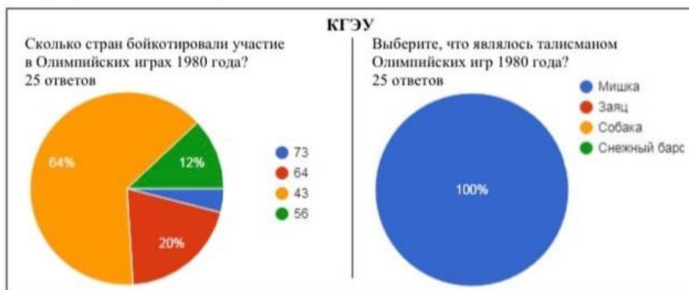
Рисунок 3 – Ответы студентов КГЭУ на вопросы по истории Олимпиады-80

Наши студенты справились с тестированием на отлично. В их памяти живы воспоминания об Играх, и это не может не радовать.