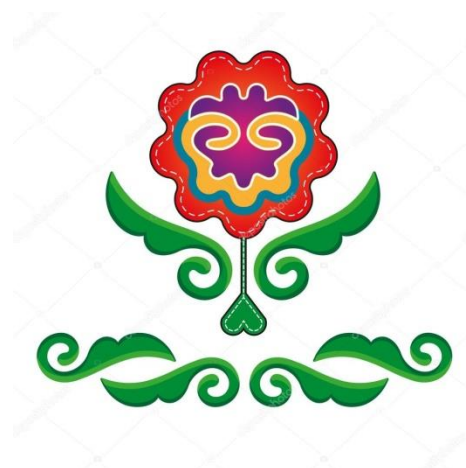
Рисунок 1.2.1. Орнамент тюльпана в татарской символике [21].

У каждого народа есть свой символ, который имеет значение только для него. Значение тюльпана в культуре и орнаменте татар велико. Много мастеров использовало татарский орнамент, в котором основным мотивом является тюльпан (см. рис. 1.2.1).