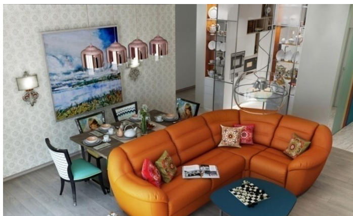
Рисунок 2.2.1. Пример оформления гостиной в современном татарском стиле [28].

По нашему мнению, при оформлении номеров стоит применить татарский стиль в современной интерпретации, то есть соединить классический стиль с элементами татарской символики. На рисунке 1 представлено примерное оформление гостиной в современном татарском стиле. На фоне обоев с орнаментами восточного дворца разместился волжский пейзаж, также можно добавить бра с татарским орнаментом. В качестве акцентов использованы чистые яркие цвета, характерные для фасадов татарских домов. Не стоит забывать и про любовь татар к демонстрации красивых чайных сервизов (см. рис.2.2.1).