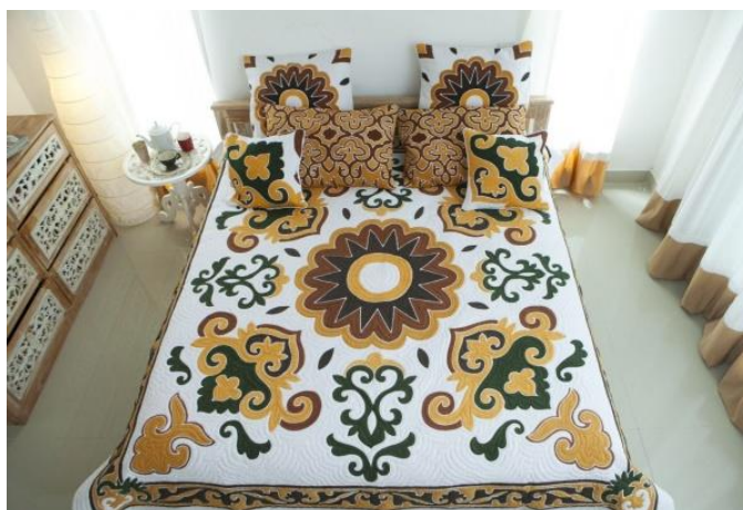
Рисунок 2.2.2. Постельное белье с татарским орнаментом [27].

Татарский интерьер также предполагает использование большого количества подушек. Мы предлагаем вместо двух обычных подушек в номере поставить вдвое большее количество, также использовать декоративные подушки меньшего размера. Уместным будет и декор постельного белья татарскими орнаментами (см. рис 2.2.2).