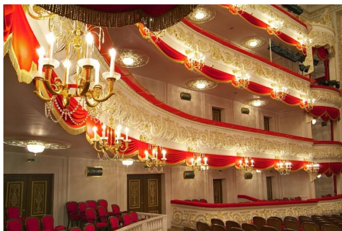
Рисунок 1.2.3. Татарский национальный орнамент в интерьере Татарского государственного театра оперы и балета имени М. Джалиля [11].

Посуда с татарскими орнаментами всегда смотрится интересно. Рисунок на ней может быть как насыщенным и колоритным, так и лаконичным, с небольшим количеством элементов, только наталкивающих на татарскую культуру. Неплохо смотрятся орнаменты и в ювелирном искусстве. Также можно, как и ранее, применить их в одежде. Причем не обязательно покрывать все изделие узорами, можно сделать лишь небольшой акцент на воротничке. Дополнит наряд текстильная брошь или пояс с татарским узором. Чехлы с орнаментами добавляют индивидуальности мобильному телефону или другому устройству. А открытка с узорами станет интересным дополнением к подарку [24].