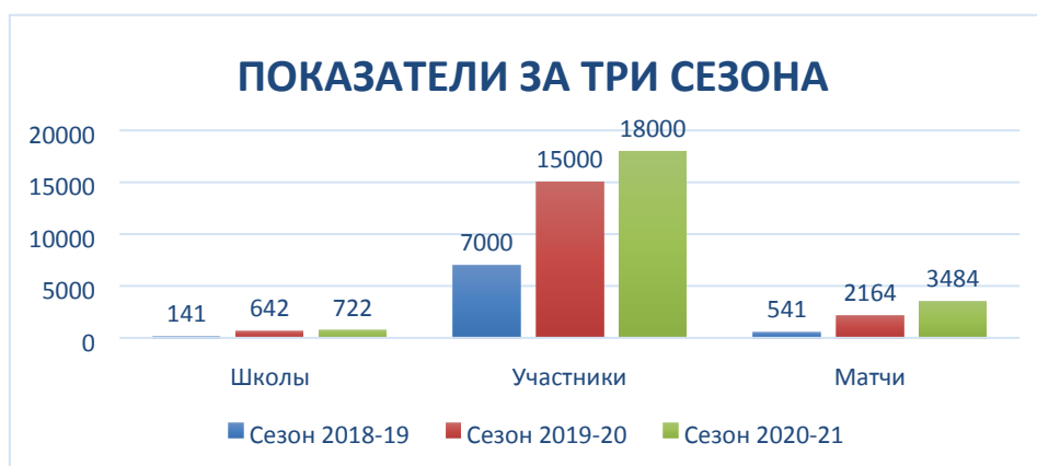
Рисунок 1 – Показатели развития турнира за три сезона Организаторы турнира «ШВЛ» РТ использует мощную поддержку в социальных сетях и на официальном сайте турнира (рис.2). С каждым сезоном число участников турнира и болельщиков растет.