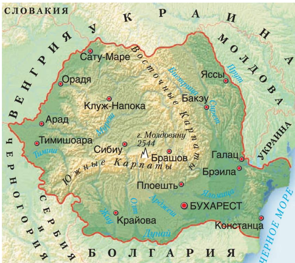
Приложение 2. Горнопромышленная карта полезных ископаемых Румынии.