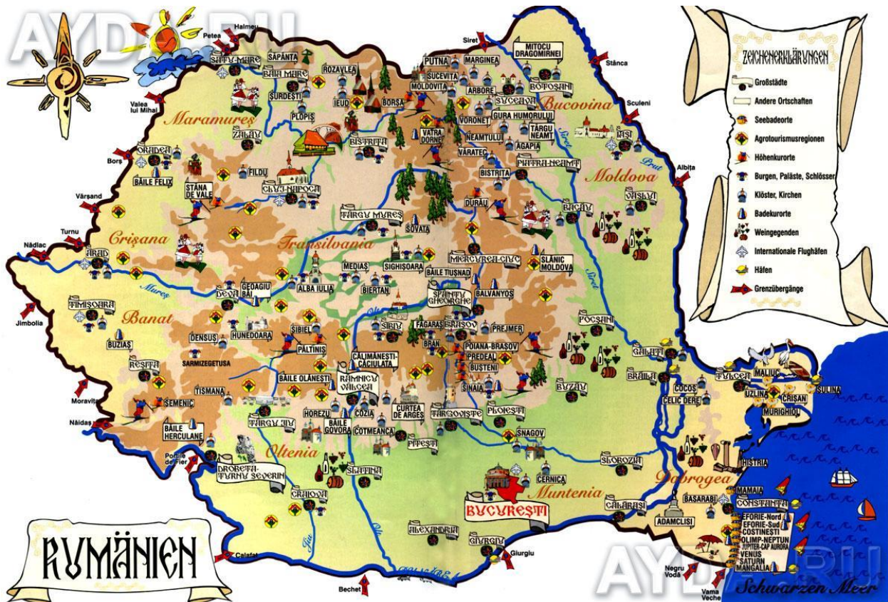
Приложение 3. Карта Румынии с городами и Курортами.