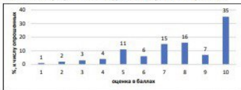
Рисунок 2 Результаты социологического опроса. Оценка уровня заинтересованности в мероприятии «X-Travel» по комбинированным видам туризма, в % к числу опрошенных

Респондентам также предлагалось указать уровень заинтересованности в физкультурно-рекреационном мероприятии «X-Travel» по комбинированным видам туризма по 10-балльной шкале, где 1 – минимальная заинтересованность, 10 – максимальная. Результаты представлены на рисунке 2. Как видим, большая часть опрошенных (36%) оценила собственную заинтересованность на максимальный балл, 16% оценили – на 8 баллов, 15% студентов – на 7 баллов. В общей сложности 79% опрошенных студентов к проведению спортивного туристического мероприятия имеют уровень интереса выше среднего.