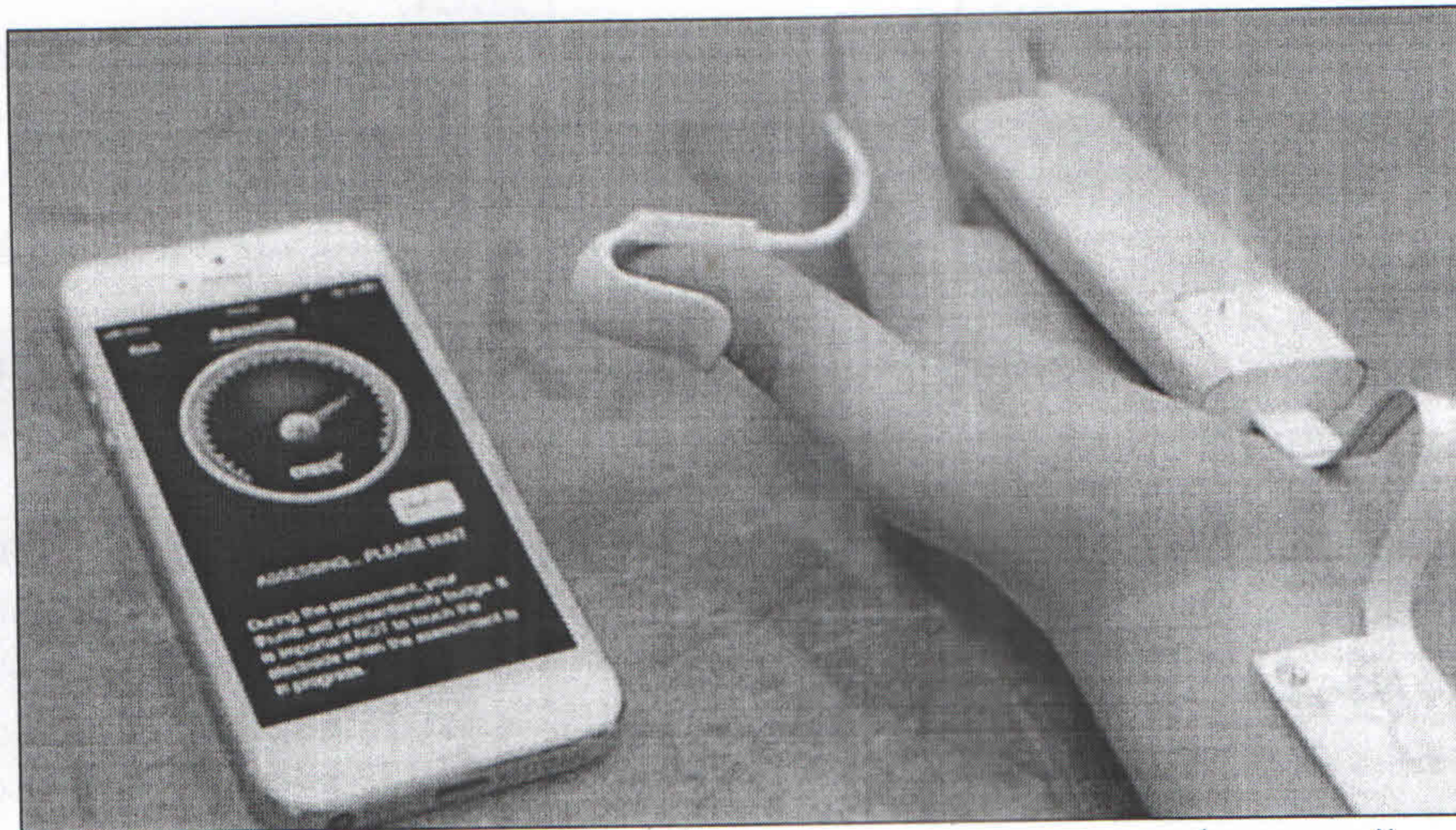
Рисунок 3 – Прибор Check для стимуляции специфической нервно-мышечной реакции мозга

Для оценки ситуации электроды прибора крепят на кисть руки. При включении прибора в работу электрический ток передается через тело в мозг спортсмена. В результате этого полученные данные и реакции нервной системы фиксируются в телефоне с помощью специальной программы. Предназначение прибора состоит в том, чтобы исследовать процессы тренировок в таких видах спорта, где требуются сила, быстрота, координация (спортивные игры, единоборства).