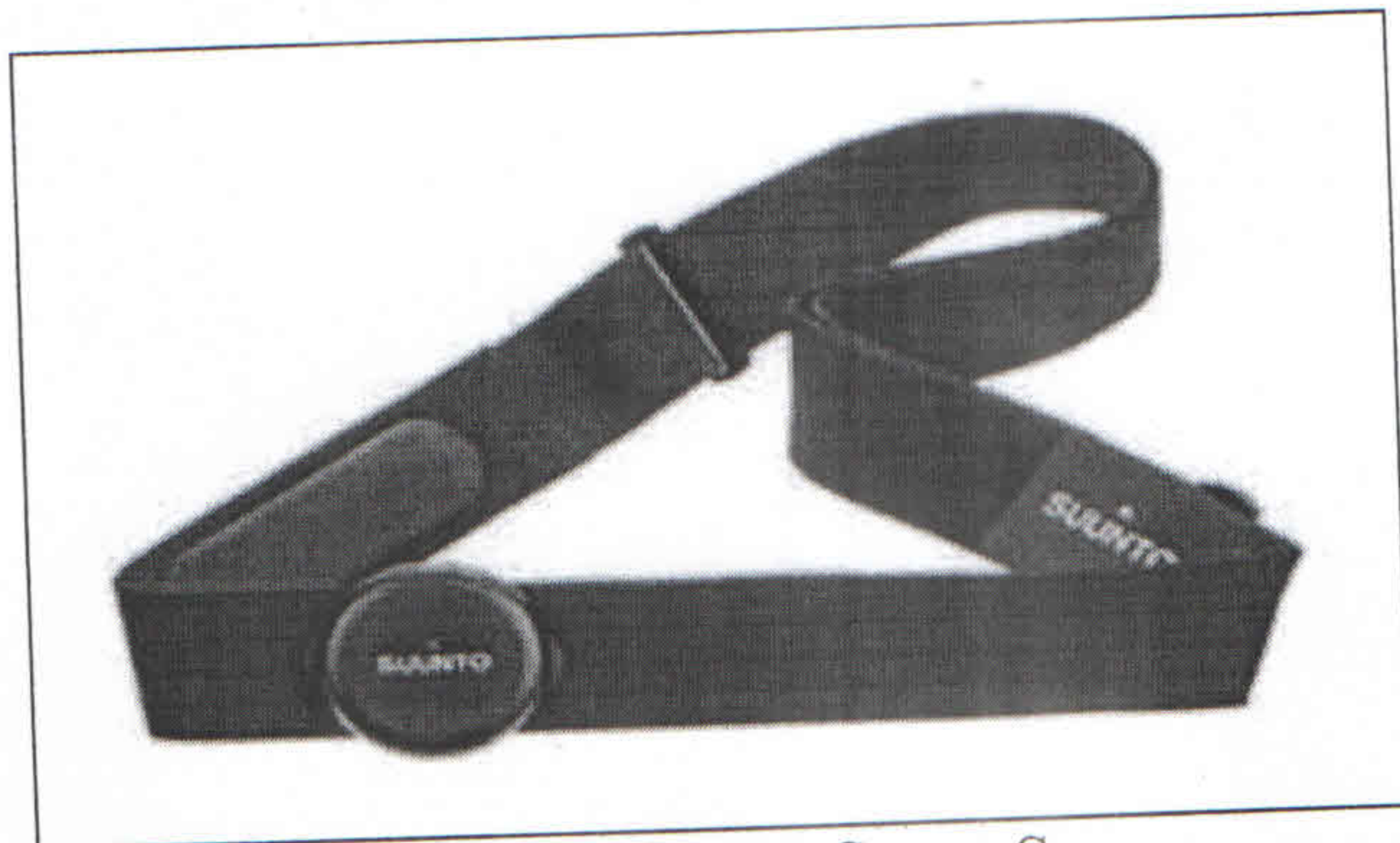
Рисунок 1 – Suunto Smart Sensor

Примеры датчиков: Suunto Smart Sensor (рис. 1), Polar H10, Garmin HRM tri.