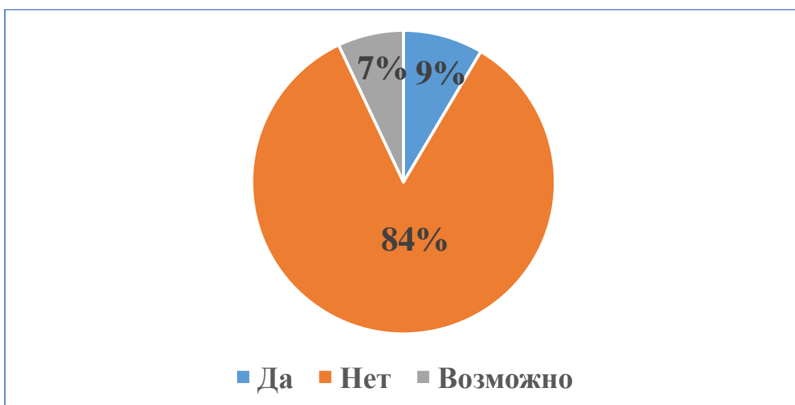
Рис. 4. Результаты ответов на вопрос «Знаете ли Вы, где в Казани можно поиграть в сквош?»

4) на вопрос «Знаете ли Вы, где в Казани можно поиграть в сквош?» (рис. 4) большинство (84%) опрашиваемых ответили «нет», 9% - «да», 7% - «ВОЗМОЖНО».