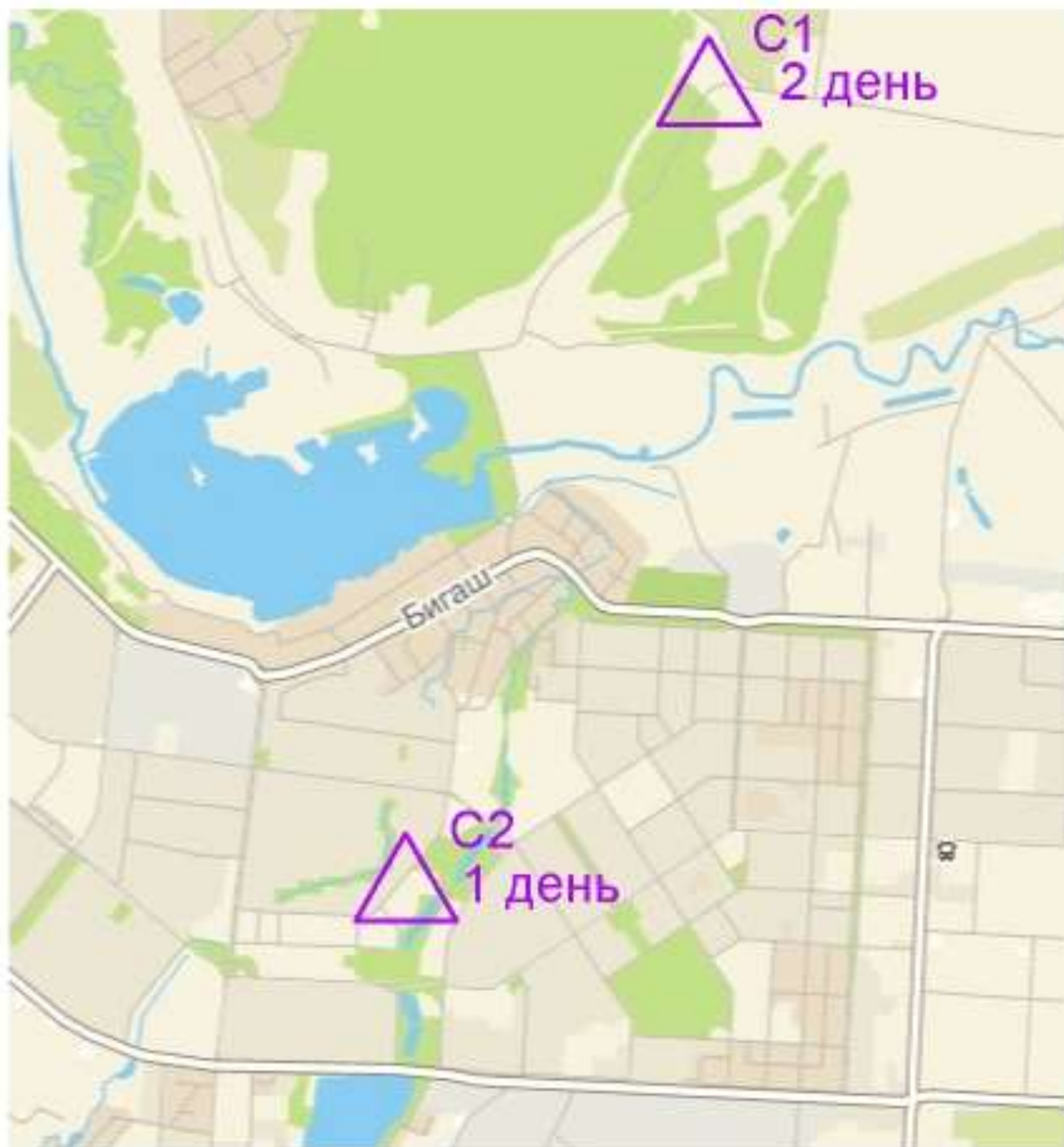
Схема расположения стартов:

Есть возможность организации питания в физкультурном колледже: ужин 21.10 - 100 руб, завтрак 22.10 - 100 руб, при предварительном заказе возможно организовать обеды 21 и 22 октября, тел. 89872614962 Гузель Нажиповна; заказ питания до 14.00 20 октября.