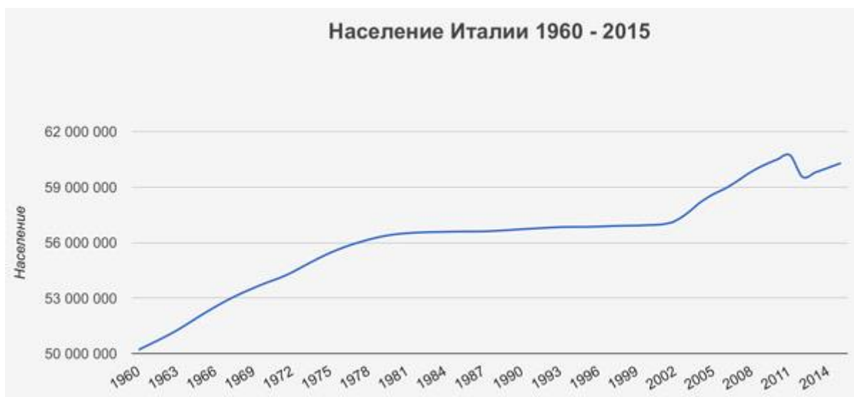
Рис. 1.3 Население Италии

которой оценивается в 60.6 миллионов человек. В 2009 году население Италии превзошло цифру в 60 миллионов. На 2.03.2013 численность населения Италии составляло 61 215 992 чел. Численность населения с 1960 по 2015 представлена на рис. 1.3