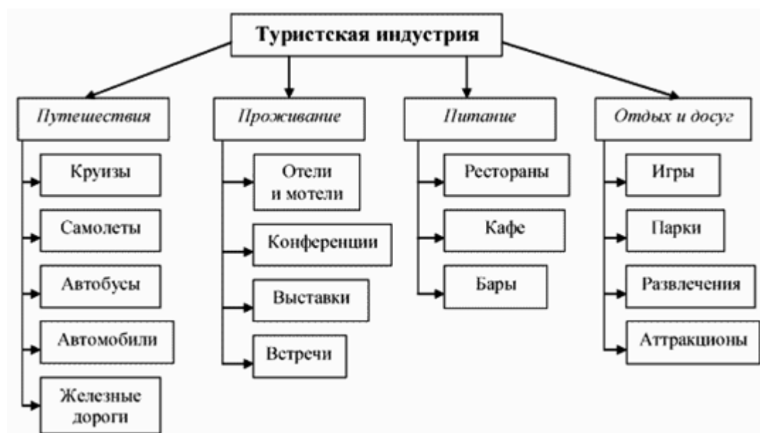
Рис. 2.1 Структура туристской индустрии по Дж.Уокеру

Таким образом, индустрия гостеприимства - это комплексная сфера деятельности работников, удовлетворяющих любые запросы и желания туристов. Структура туристской индустрии представлена на рисунке 2.1