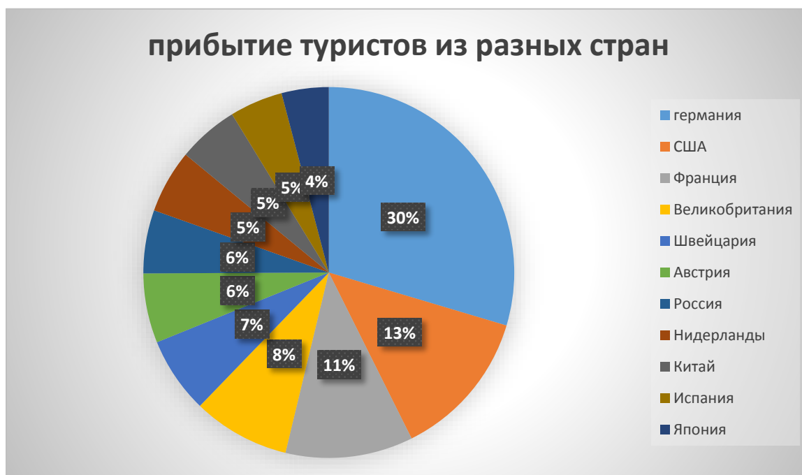
Диаграмма 2.1 Рейтинг прибытия туристов из разных стран