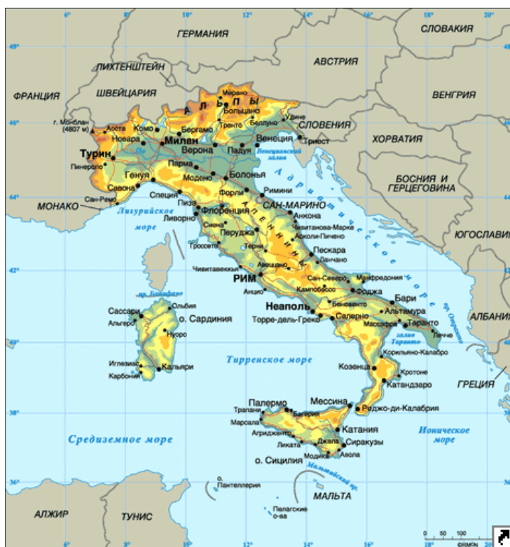
Рис. 1.1 Италия на карте мира

материка узким Мессинским проливом, находится действующий вулкан Этна (3323 м). Карта территории Италии представлена на рисунке. (см.рис. 1.1). Краткий анализ Италии представлен в (таблице 1.1)