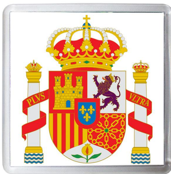
Рис.2 Национальный герб Испании

Символическое значение цветов этого флага легенда связывает с его происхождением. Согласно преданию, один из королей Арагона пожелал иметь своё знамя. Осматривая различные проекты знамён, он остановился на одном с гладким золотым полем. Затем он велел подать кубок свежей крови животных и, окунув в него два пальца, монарх провёл ими по жёлтому полотнищу, на котором получились две красные полосы.