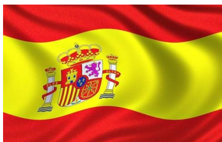
Рис.1 Государственный флаг Испании

Испания является социальным, демократическим государством, политическая форма которого — парламентская монархия. Столица- Мадрид. Государственный флаг Испании характеризует национальное развлечение – корриду. Действует Конституция, одобренная на общенациональном референдуме 6 декабря 1978 и вступившая в силу с 29 декабря 1978.